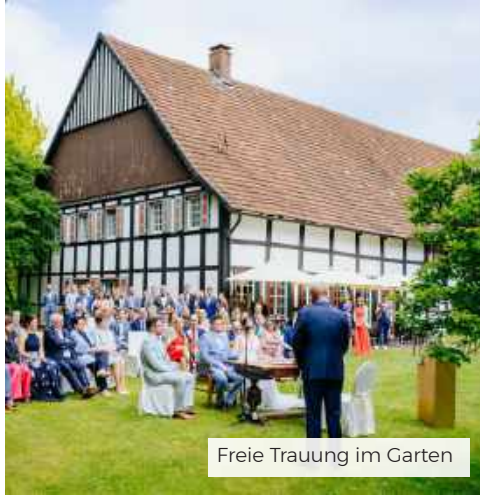
Freie Trauung im Garten