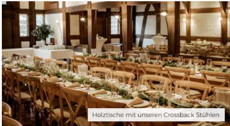
Holztische mit unseren Crossback Stühlen