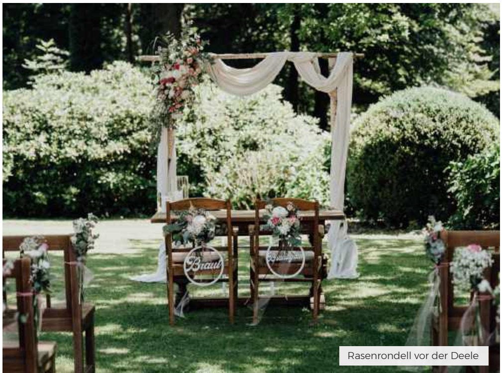
Rasenrondell vor der Deele