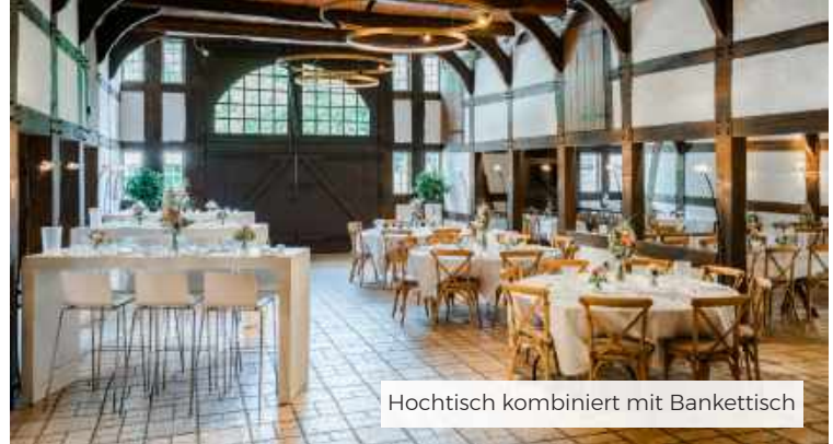
Hochtisch kombiniert mit Bankettisch