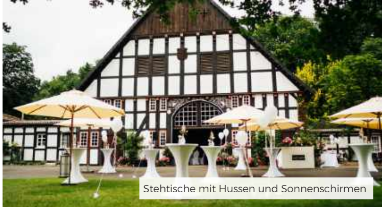
Stehtische mit Hussen und Sonnenschirmen

Hier erhalten Sie einen Einblick in unser Mietmobiliar. Eine weitere Auswahl finden Sie im Mietshop unter: www.derramselhof.de/mietshop